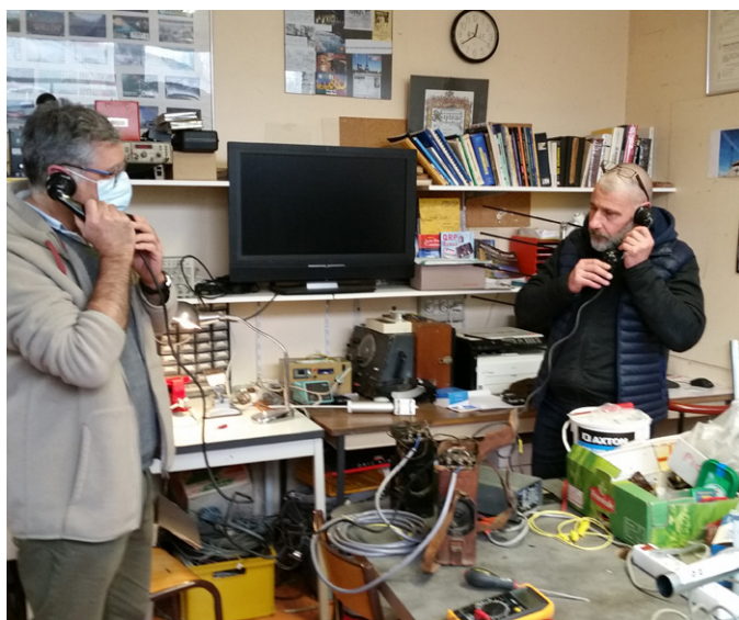
Essai après restauration de téléphones de campagne guerre 39/45.